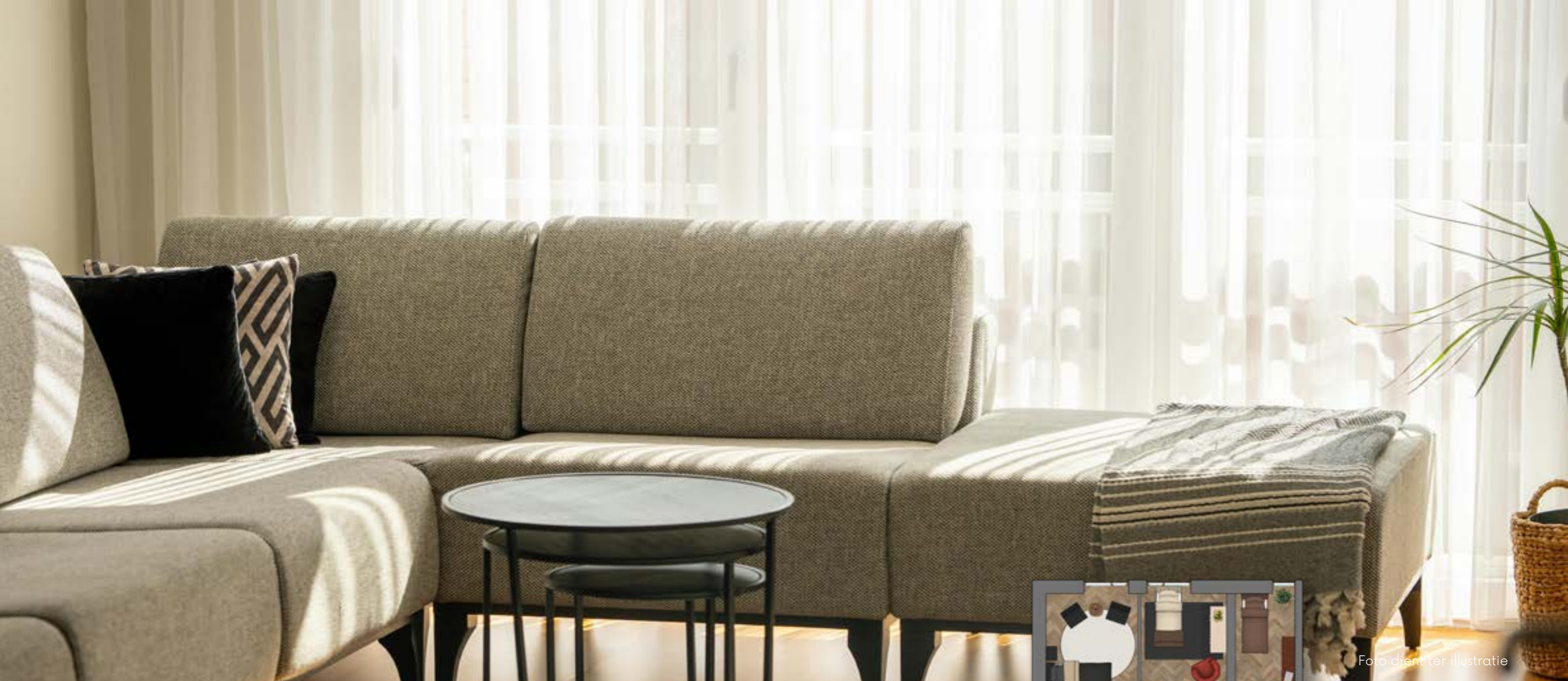
Foto dient ter illustratie