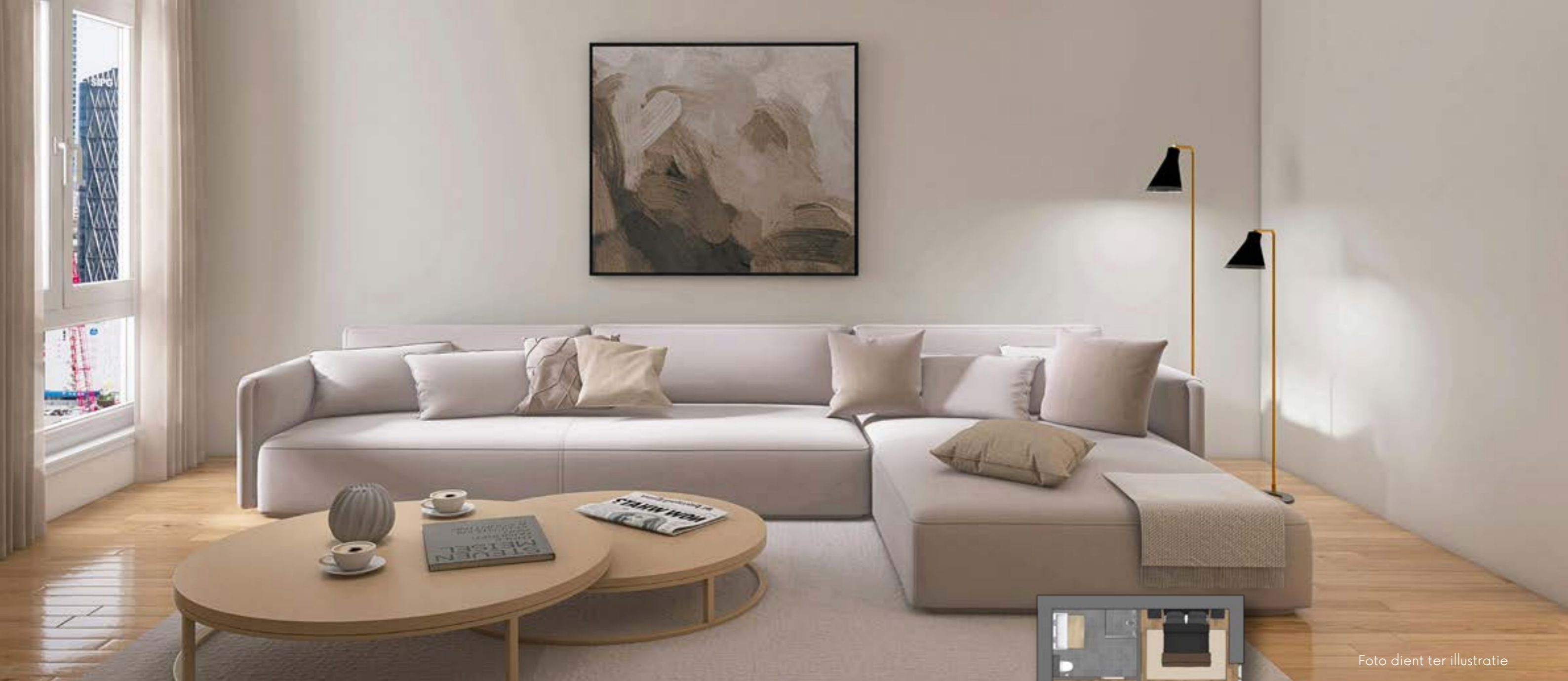
Foto dient ter illustratie