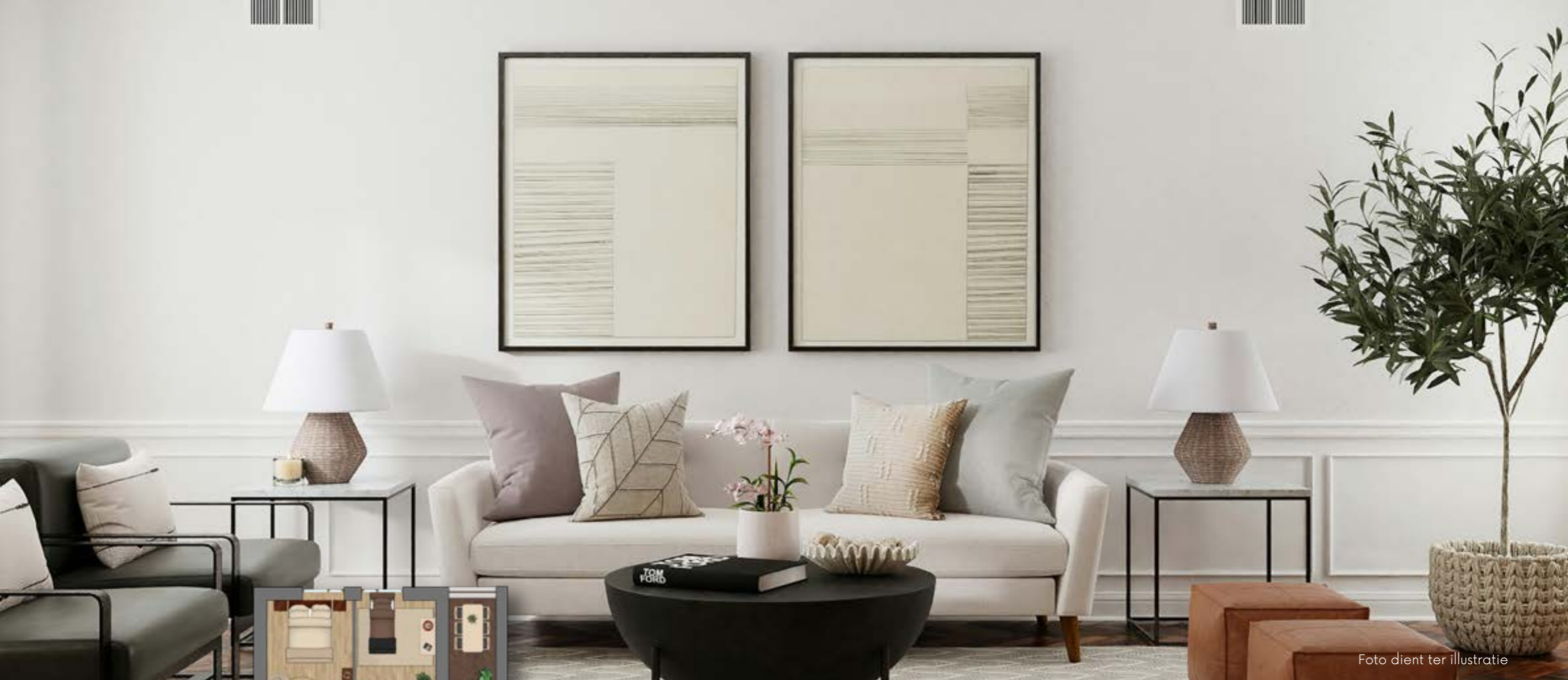
Foto dient ter illustratie