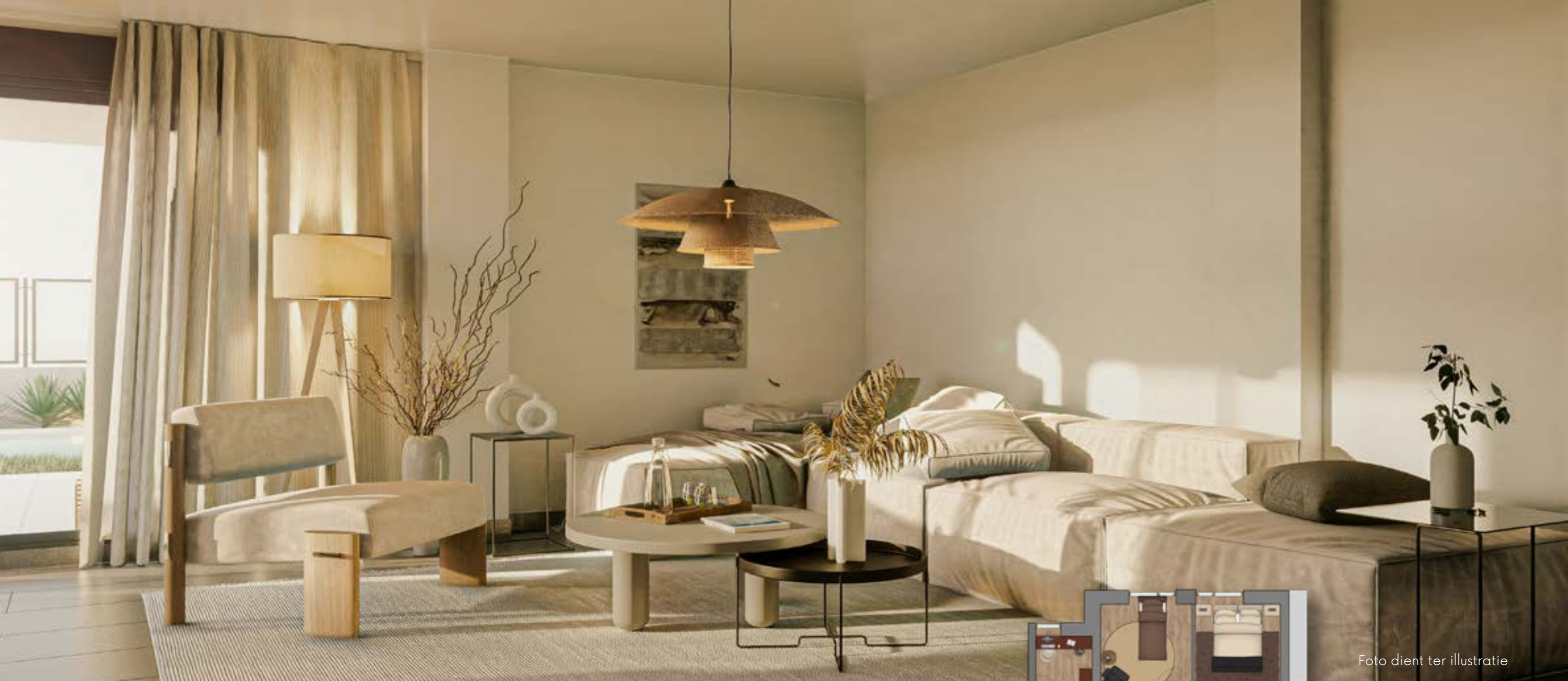
Foto dient ter illustratie