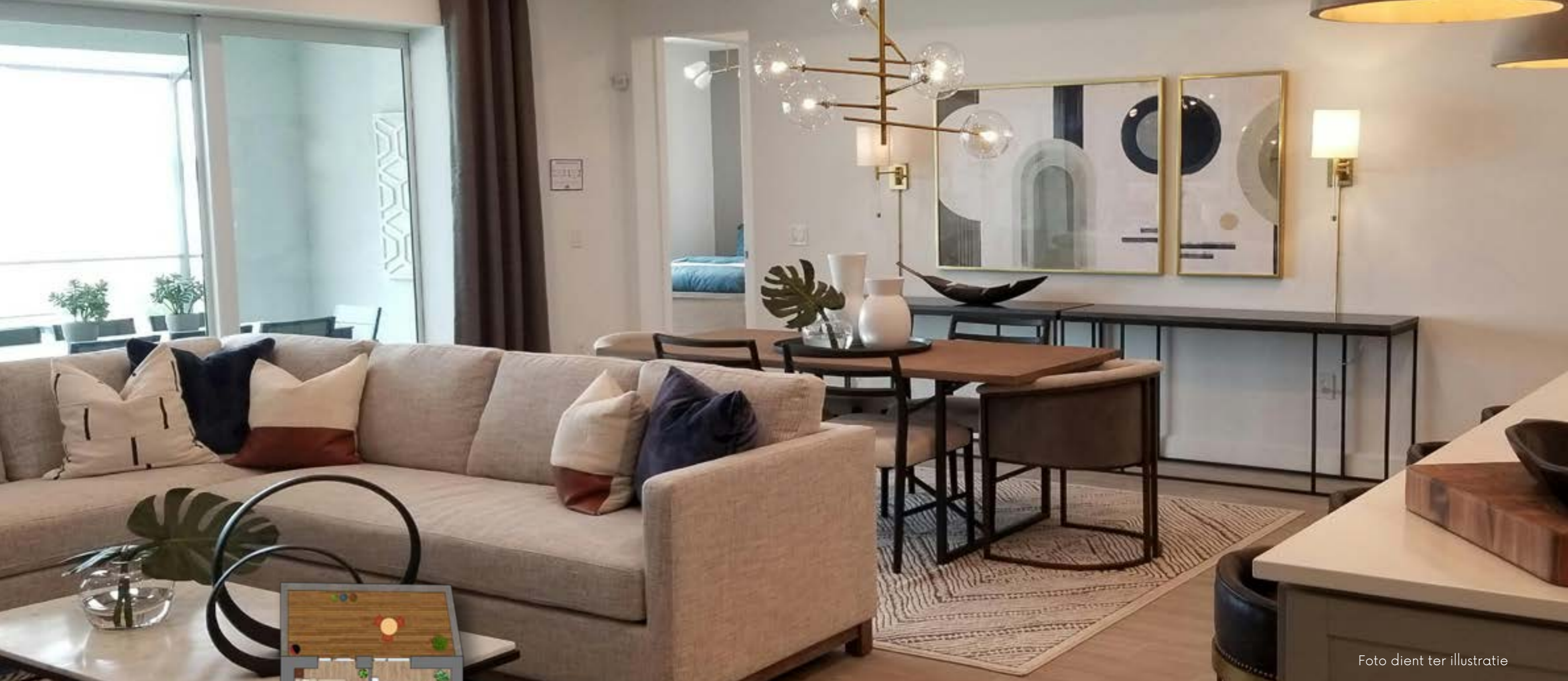
Foto dient ter illustratie